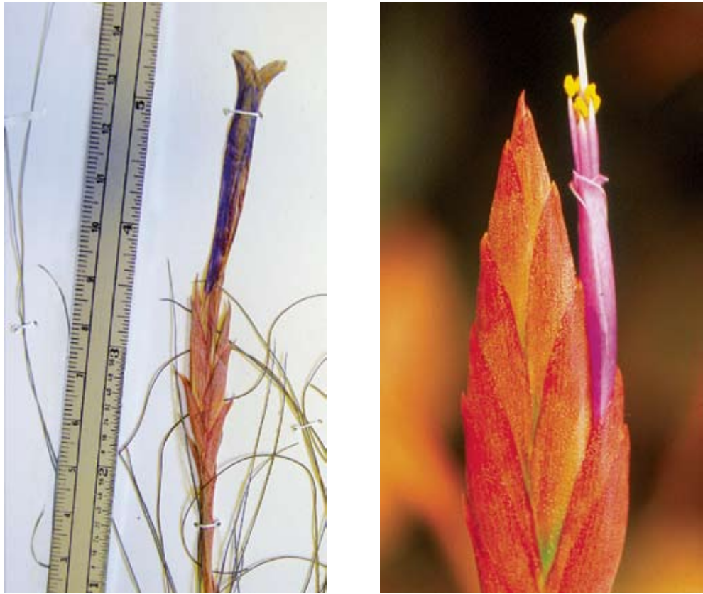
Fig. 2. A. Tillandsia chaetophylla Mez. (detalle del ejemplar: A. Salinas y E. Martínez 5980 (MEXU) B. Tillandsia sessemocinoi Espejo, López-Ferrari y Blanco (fotografía de la espiga correspondiente al espécimen: A. R. López-Ferrari et al. 2780).

espiga oblonga a oblongo-elíptica, aplanada, de 3.5 a 5.5 cm de largo por 1 a 1.3 cm de ancho; brácteas florales rosadas, oblongo-lanceoladas, de 2.2 a 2.5(2.7) cm de largo por 8 a 10 mm de ancho, más largas que los entrenudos, imbricadas, nervadas, ecarinadas, lepidotas, acuminadas y excurvadas en el ápice; flores dísticas, erectas, 3 a 4(5) por espiga, actinomorfas, subsésiles, formando una corola hipocraterimorfa; sépalos verdes, angosta y largamente lanceolados, de 3 a 3.2 cm de largo por 3.5 a 4 mm de ancho, nervados, glabros, con un amplio margen hialino, largamente atenuados a acuminados en el ápice, los dos posteriores carinados y connatos en casi toda su longitud; pétalos libres, de color violeta, oblongo-espatulados, de 6.5 a 6.8 cm de largo por 6 a 7 mm de ancho, redondeados a agudos y excurvados en el