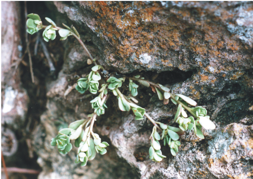
Fig. 2. Portulaca guanajuatensis en su habitat natural.