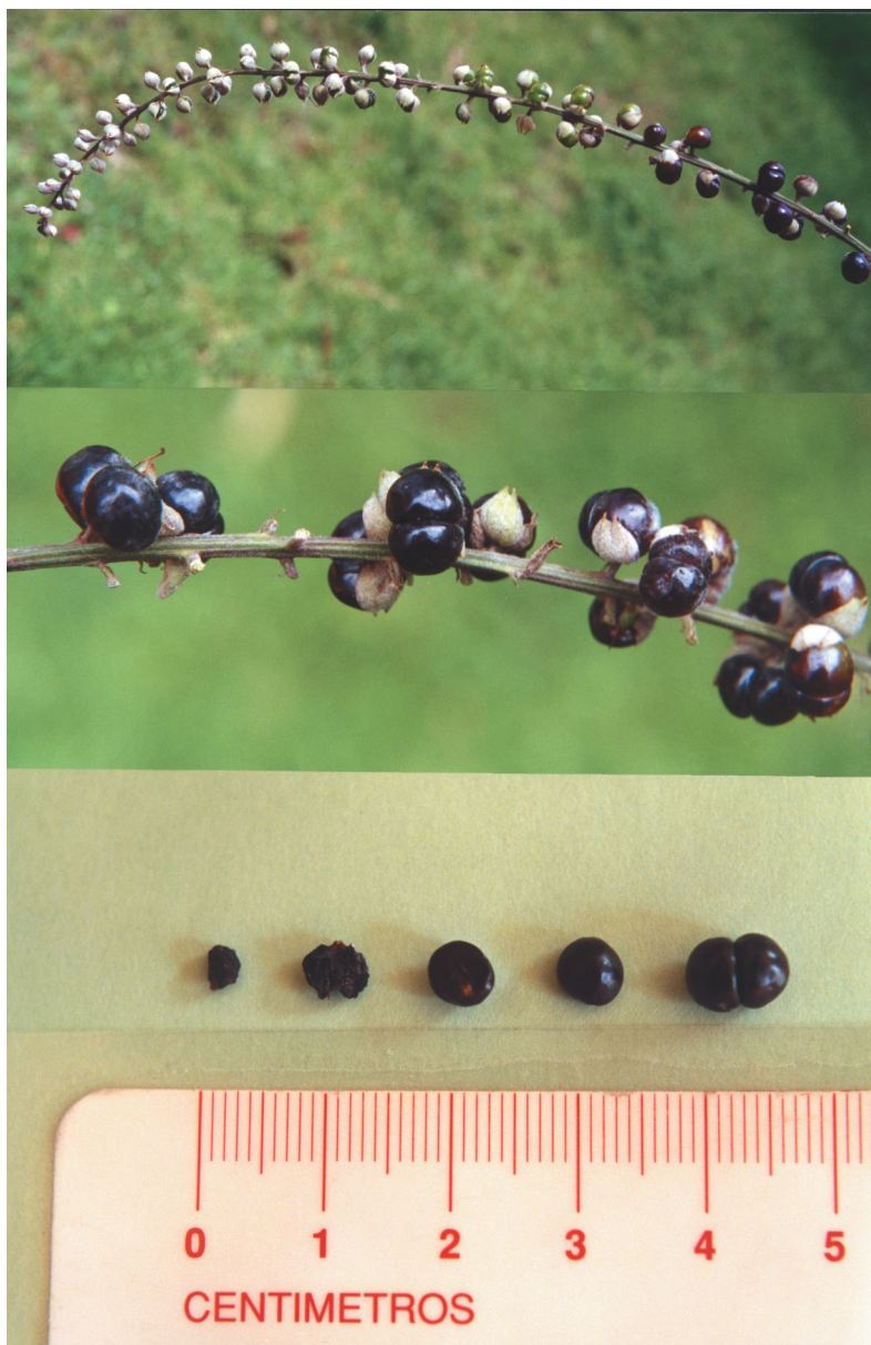
Fig. 2. Priva aspera H.B.K. Infrutescencia en desarrollo, así como acercamiento de frutos maduros y drupas parciales. Los de la extrema izquierda de la hilera de abajo representan frutos deshidratados encontrados en un ejemplar de herbario.