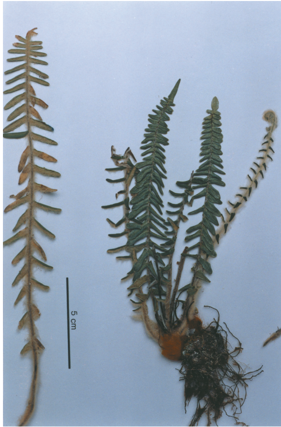
Fig. 1. Pellaea ribae Mendoza & Windham. Hábito de la planta y vista abaxial de la pinna; obsérvese la presencia de abundantes tricomas en toda la planta.

Esporangios esparcidos o poco diferenciados en las puntas de las venas, muy cortamente pedicelados (subsésiles), conteniendo 64 esporas, parafisos ausentes. Esporas de 53 (55) 60 \mu\text{m} de diámetro, triletes, tetraédrico-globosas a globosas, perina rugulada a rugosa, crestada, a menudo equinulada, de color pardo oscuro.