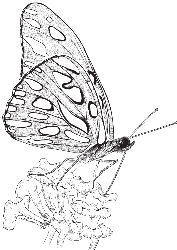
Prancha 3. Agraulis vanillae (Nymphalidae) coletando néctar em Lantana camara .