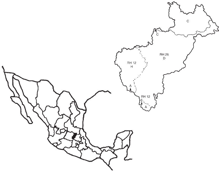
Fig. 1. Localización del estado y cuencas principales. RH 12: región hidrológica del Lerma–Chapala–Santiago; A es la cuenca del río Lerma–Toluca y H es la del río Laja. RH 26 es la región hidrológica del Pánuco; C es la cuenca del río Tamuín y D es la cuenca del río Moctezuma. Adaptado de Anónimo (1986).

(Zamudio et al., 1992), una diversidad mayor a la de toda la península de Yucatán, Guanajuato o Coahuila.