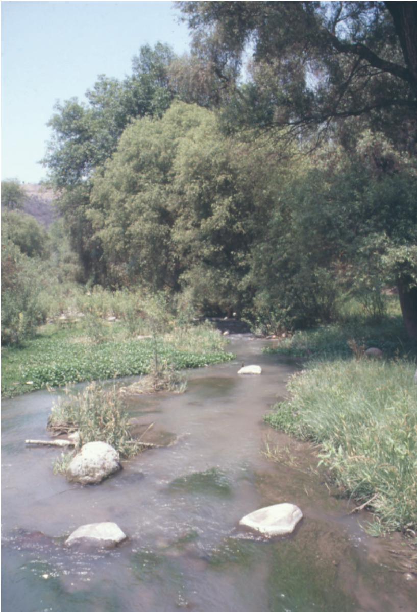
Fig. 3. Río El Pueblito con bosque en galería de Salix y Fraxinus . La sumergida es Zannichellia palustris .