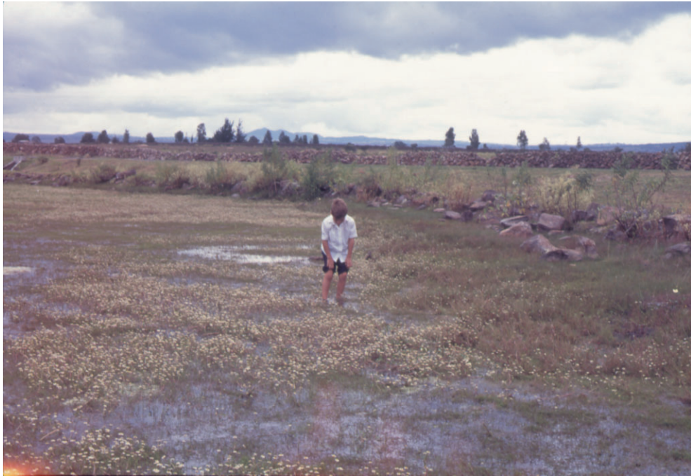
Fig. 4. Charco temporal en la zona de Amealco–Huimilpan en noviembre.

Myriophyllum hippuroides , Najas guadalupensis , Potamogeton diversifolius , Sagittaria demersa , Crassula aquatica , Zannichellia palustris son las enraizadas sumergidas y entre las de hojas flotantes se colectaron Bacopa rotundifolia , Callitriche heterophylla , Hydrochloa caroliniensis , Marsilea mollis y Nymphoides fallax . Como hidrófita libre sumergida califica Utricularia perversa y tampoco faltan las libres flotadoras Azolla filiculoides y Lemna aequinoctialis , aunque éstas últimas no se presentan todos los años y su distribución es muy localizada. A algunas de las plantas usualmente sumergidas como Sagittaria demersa o Myriophyllum hippuroides se les observan hojas fuera del agua, sobre todo hacia el final de la estación de crecimiento cuando el nivel de los embalses empieza a bajar. La riqueza florística más alta de uno de los charcos grandes llega a 31 especies de acuáticas y subacuáticas, mientras que en los cuerpos de agua menos diversos se han encontrado únicamente dos, el total correspondiente a la región de Amealco y Huimilpan suma 34 especies.