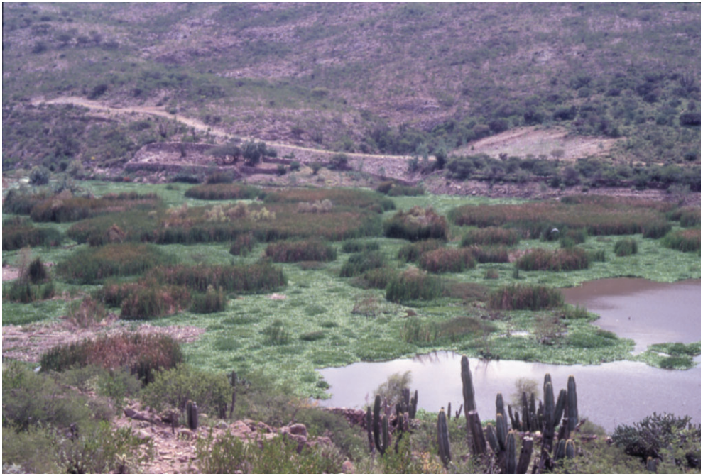
Fig. 5. Presa de la Soledad en Colón infestada por Eichhornia y Typha .

Vegetación de presas y canales de riego: Las presas de Colón, La Llave y Rayas presentan fuertes invasiones de Eichhornia y Typha (Fig. 5). En los canales de desagüe de los reservorios se encontró mayor diversidad de plantas acuáticas, sobre todo en el de Rayas y de Constitución de 1917, donde prospera el arbusto Heimia salicifolia y entre las hidrófitas enraizadas emergentes crecen Eleocharis sp., Hydrocotyle ranunculoides , Juncus sp., Lilaeopsis schaffneriana , Mimulus glabratus , Paspalum dilatatum , Rorippa nasturtium-aquaticum y Typha latifolia . Como planta sumergida sólo se encontró a Zannichellia palustris , y de las libres flotadoras a Azolla filiculoides , Eichhornia crassipes , Lemna gibba y Wolffia columbiana . Las hidrófitas de tallos postrados están representadas por Heteranthera reniformis y Ludwigia peploides .