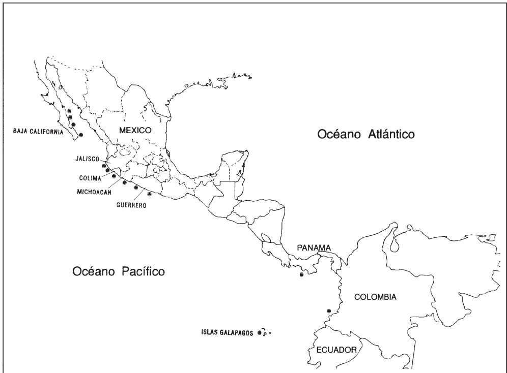
Fig. 6. Codium picturatum . Distribución conocida.

Codium hubbsii y C. setchellii son miembros del grupo C. adhaerens , en el cual utrículos hijos se producen por gemación de los utrículos parentales, dando por resultado agrupaciones (familias) fácilmente disgregables por disección, carácter por mucho tiempo empleado para distinguir al subgénero Tylecodium (Setchell en Lucas, 1935).