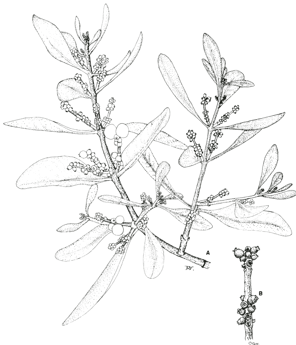
Fig. 2. Dendrophthora costaricensis Urban (M. Cházaro y H. Oliva 5253, IBUG). A. Ramilla con frutos jóvenes y maduros; B. Espiga femenina, con frutos muy jóvenes.