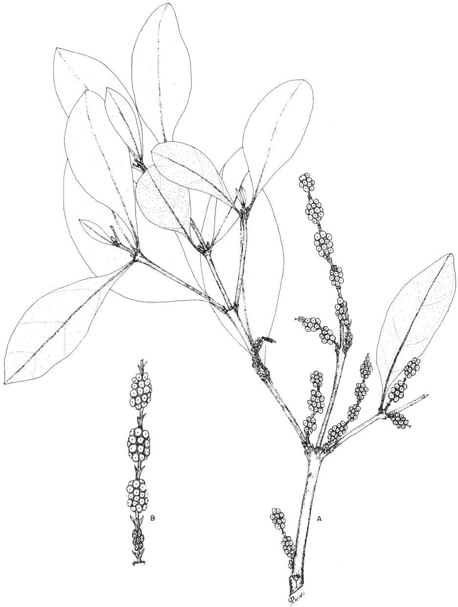
Fig. 1. Phoradendron oliverianum Trel. A. Rama con infrutescencias; B. Infrutescencias (P. Tenorio L. et al. 13925, MICH Y MEXU).